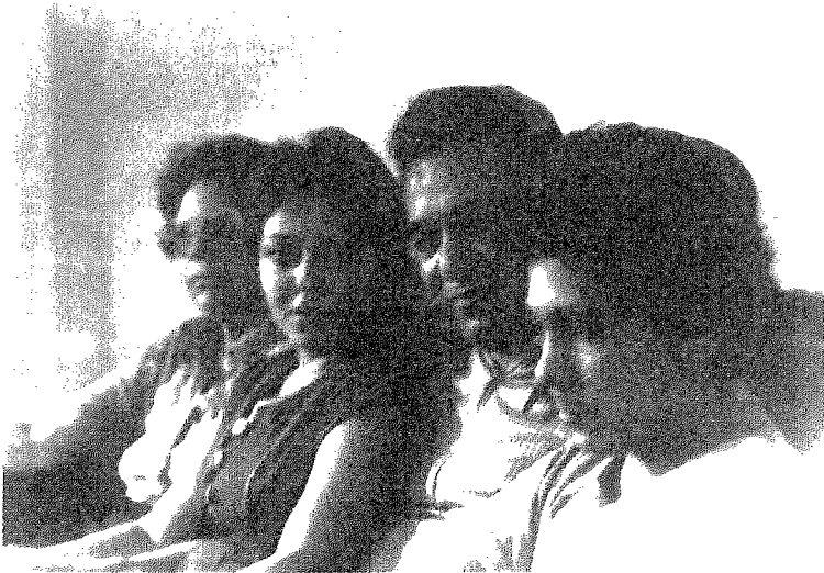
اجتماع العائلة في بيروت ١٩٧٩